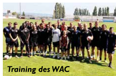
Training des WAC