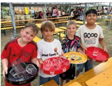
Fleißige Helfer beim Sportfest